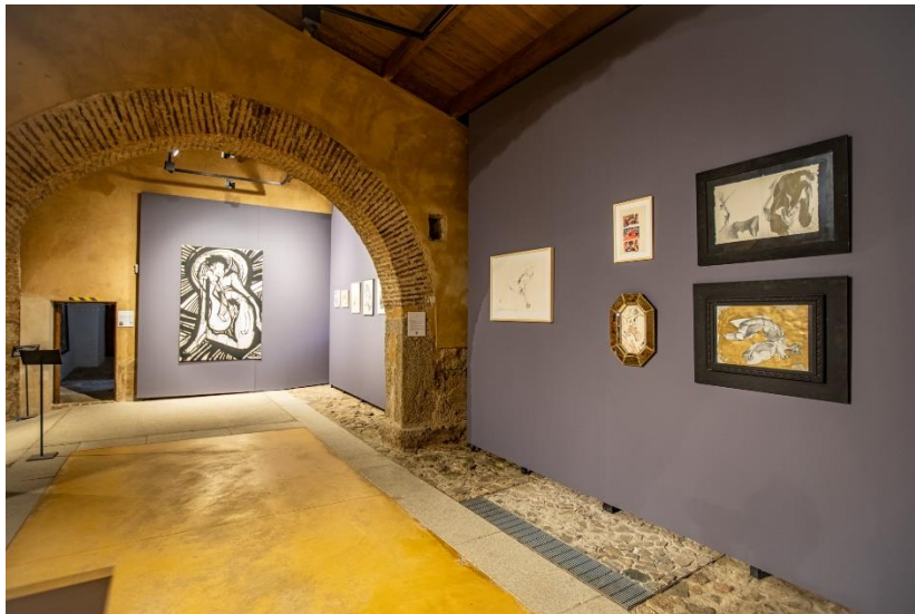
Vista de la exposición HOMMAGE A MERCEDES .