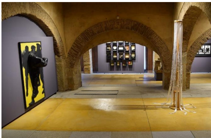
Vista general de la exposición En todas direcciones .