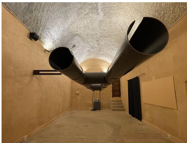
Instalación sonora de Staalplaat Soundsystem en el Museo Vostell Malpartida.

Staalplaat Soundsystem ha presentado su trabajo en un gran número de festivales, museos y galerías internacionales de renombre: Kiasma (Helsinki), Sónar (Barcelona), 798 South Gate space (Pekín), DEAF (Rotterdam), Transmediale (Berlín), Ars Electronica (Linz), Today'sart (La Haya), MOCA (Taipei), Museum Weserburg (Bremen), Townhouse Gallery (El Cairo), Steirischer Herbst (Graz), ZKM (Karlsruhe), Palais de Tokyo (París), Khoj International Artists (Nueva Dehli), Auditorium (Roma), Oerol (Terschelling), Los Angeles Contemporary Exhibitions, CMMAS (Morelia-México), Sonic Acts en el Stedelijk Museum (Ámsterdam), etc.