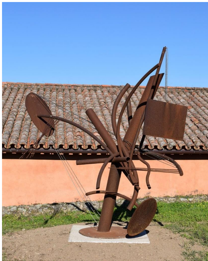
El árbol de la música , de Wolf Vostell, en el MVM.

La escultura El árbol de la música ejemplifica la hibridación de los medios y lenguajes empleados por el artista en su proceso de creación a partir de la vida cotidiana, las contradicciones del ser humano del siglo XX y la naturaleza. La estructura de metal se comporta como un arpa de viento y es este fenómeno el que hace que se manifieste la música de la vida.