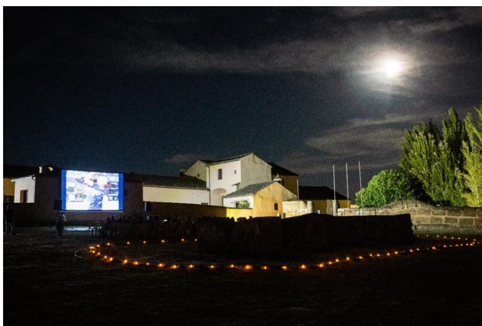
Proyección de la película Anselm en el Museo Vostell Malpartida.

En ella se proyectó la película Anselm , de Wim Wenders. Además, se entregó el premio Taejo Internacional a la película más votada por el público.