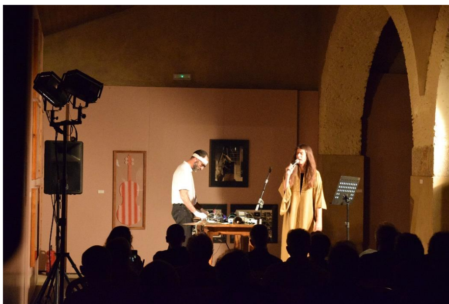
Concierto de Von Calhau!

Coproducción del Centro Nacional de Difusión Musical (dependiente del Instituto Nacional de las Artes Escénicas y de la Música del Ministerio de Cultura), el Consorcio Museo Vostell Malpartida, la Consejería de Cultura, Turismo, Jóvenes y Deportes de la Junta de Extremadura, el Ayuntamiento de Malpartida de Cáceres y la Diputación de Cáceres. Con la colaboración de la Embajada de Portugal en Madrid, el Instituto Camões, el Ministério da Cultura de Portugal, la Filmoteca de Extremadura, la Asociación de Amigos del Museo Vostell Malpartida y la Cafetería-Restaurante Museo Vostell.