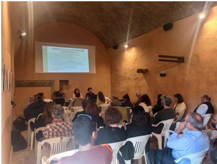
XV Congreso Internacional de Agricultura Ecológica y II Congreso Extremeño de Agroecología en "El Molino" del MVM.