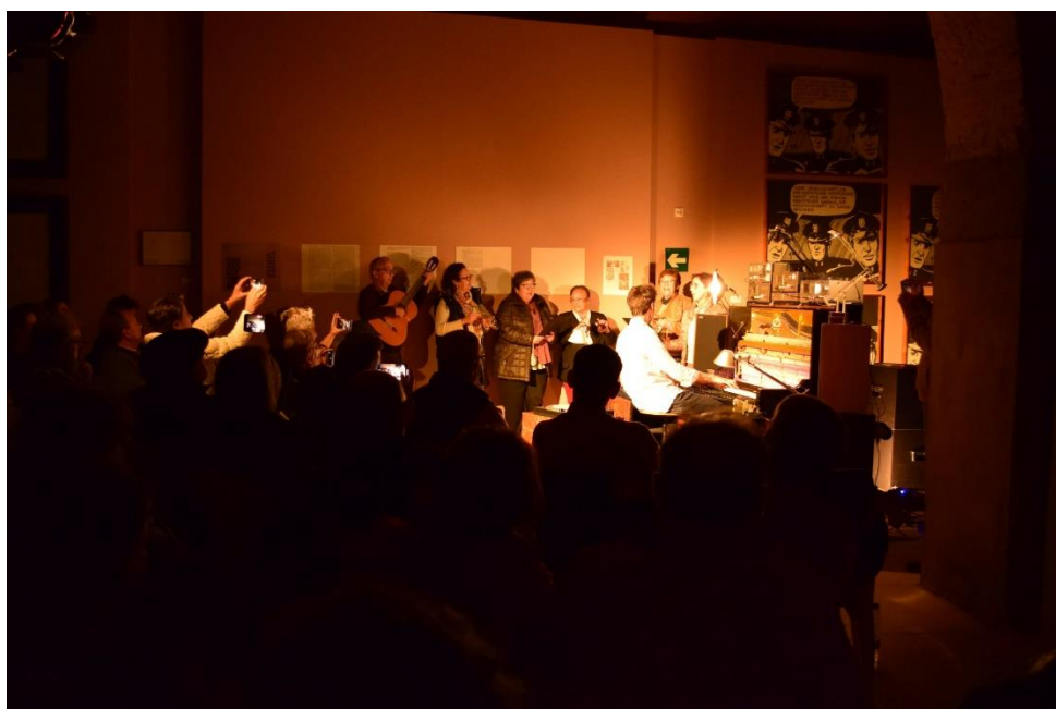
Murmurations en el Museo Vostell Malpartida.

Se trató de una gira eco-responsable que evitó los trayectos en avión, desarrolló un modelo de espectáculo autónomo y priorizó las giras o residencias sobre las fechas aisladas.