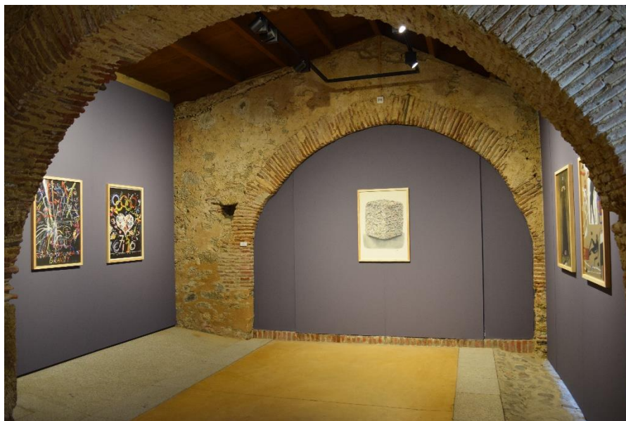
Vista de la exposición OLYMPIA. Una alianza entre el deporte, la educación y el arte .