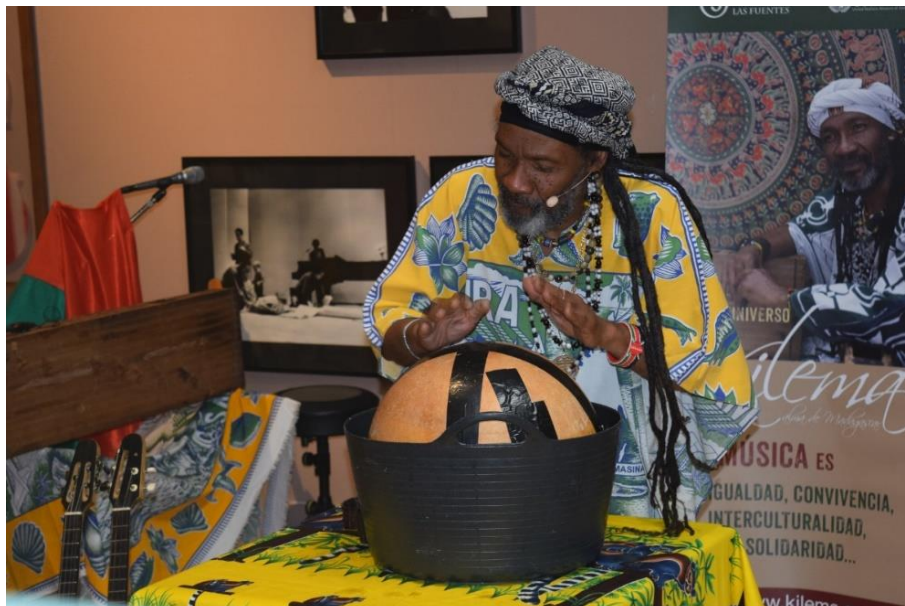
Alma de Madagascar en el MVM.