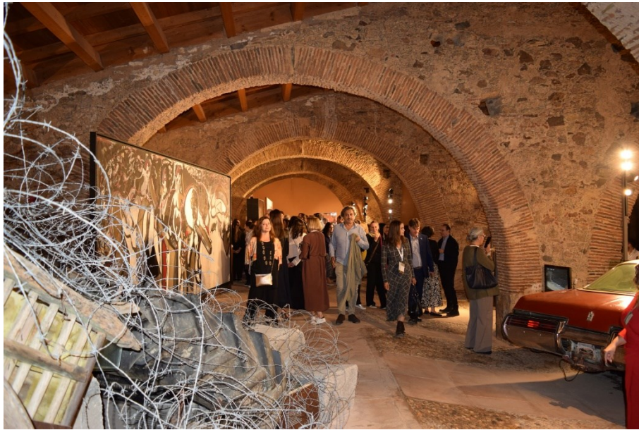
Profesionales del sector turístico en el Museo Vostell Malpartida

La V Convención Turespaña tuvo lugar en la ciudad de Cáceres del 6 al 9 de octubre e incluyó una visita de sus asistentes y profesionales del sector al Museo Vostell Malpartida el 8 de octubre. Todos ellos disfrutaron de un museo único situado en pleno corazón del Monumento Natural de Los Barruecos en Malpartida de Cáceres. Durante la visita, pudieron conocer nuestras colecciones y disfrutar de una cena en el patio del museo en un ambiente especial.