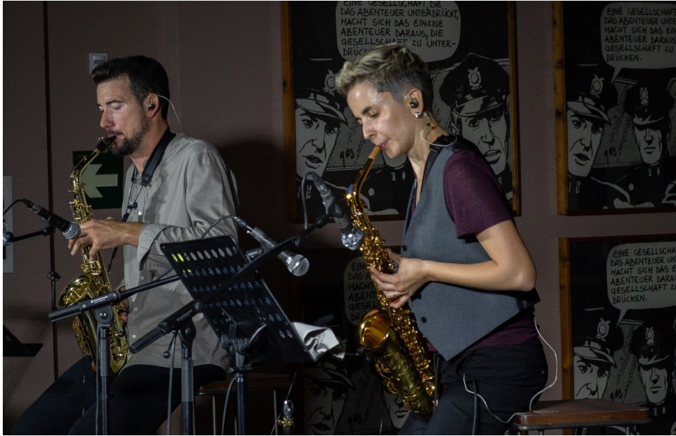
Concierto de Altera Inde en el Museo Vostell Malpartida