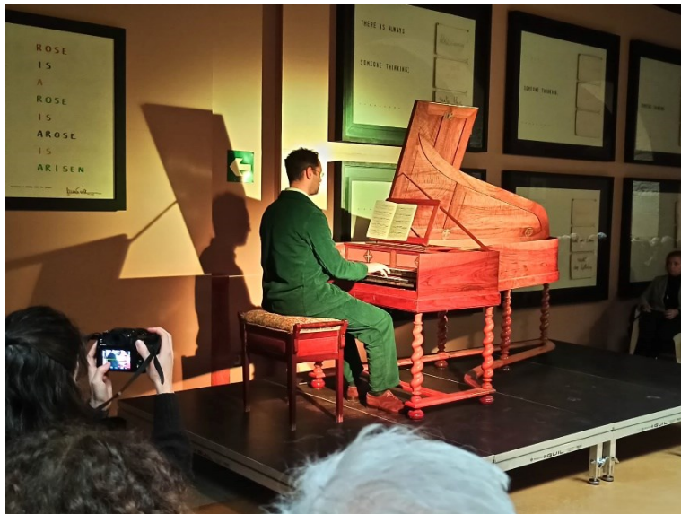
Benjamin Alard en el MVM

Benjamin Alard, una de las grandes figuras actuales de los teclados antiguos, reconocido por sus grabaciones de Bach y por una trayectoria marcada por la investigación histórica y la excelencia interpretativa.