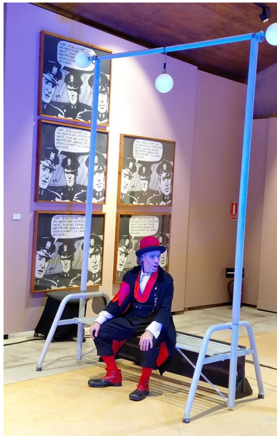
Sueños en el Museo Vostell Malpartida

Esta actividad navideña fue organizada por el Consorcio Museo Vostell Malpartida y la Asociación de Amigos del Museo Vostell Malpartida en colaboración con el Ayuntamiento de Malpartida de Cáceres.