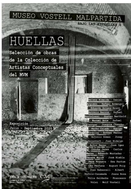
Póster de la exposición colectiva Huellas