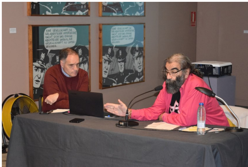
Charla de Antonio Gómez en el MVM

Residente en Mérida desde 1977, Antonio Gómez nació en Cuenca, ciudad donde vivió con entusiasmo la creación del museo de arte abstracto español y donde expuso por primera vez a los veinte años. Desde entonces, su obra ha sido mostrada en centenares de exposiciones en más de treinta países y a día de hoy es el artista vinculado a Extremadura y centrado en prácticas artísticas alternativas al discurso oficial (poesía experimental, performance, libros-objeto, arte postal, revistas ensambladas, etc.) más reconocido y valorado internacionalmente. Su poema visual "Disparos de luz" forma parte de la Colección de Artistas Conceptuales del Museo Vostell Malpartida, que en el año 2014 organizó la exposición de tesis "Fluxpost" haciendo converger una selección de fondos propios del Archivo Happening Vostell con material proveniente con la colección de Antonio Gómez, principalmente libros-objeto, revistas ensambladas y piezas de arte postal.