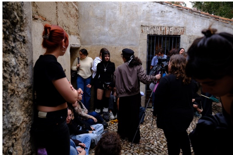
Estudiantes de Bellas Artes de la Universidad del País Vasco en el Museo Vostell Malpartida

Esta colaboración, impulsada por la Facultad de Bellas Artes de la Universidad del País Vasco y el Consorcio Museo Vostell Malpartida, se ha consolidado como una cita anual imprescindible y como ejemplo de aprendizaje mutuo con las comunidades que valora los procesos y comparte los resultados, así como también como un modelo de intercambio entre arte contemporáneo, naturaleza y vida.